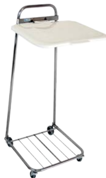
1102x/1103x with wheels