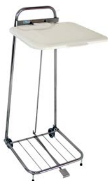
1102x/1103x Erik 60/125 with Pedal

Erik Säckhållare med/utan pedal/ Erik sack holder with/wo pedal